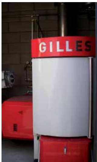
Caldaja con agitatore ceneri