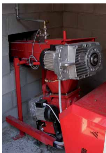
Sistema di carico del cippato con rotocella